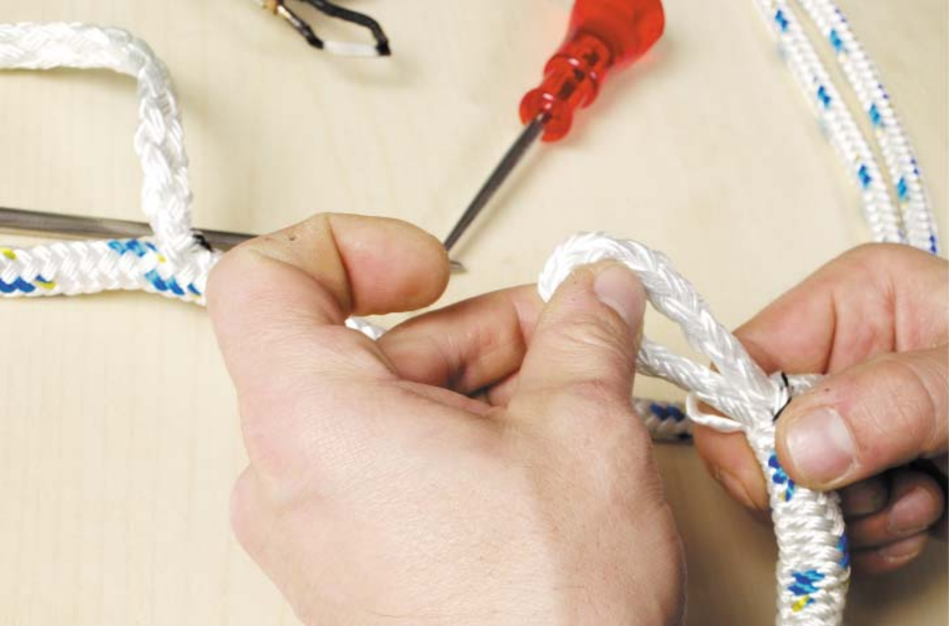
Seil mit herausgezogenem Kern.